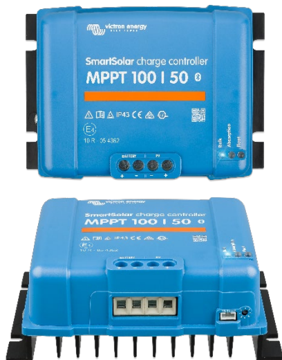
Regolatori di carica SmartSolar MPPT 100/50

Si ricollega a una batteria agli ioni di litio completamente scarica, con la funzione di disconnessione integrata.