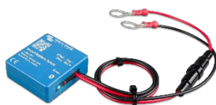
Rilevamento Bluetooth Rilevatore Smart Battery