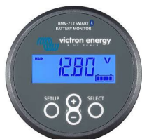
Rilevamento Bluetooth Dispositivo di controllo della batteria Smart BMV-712